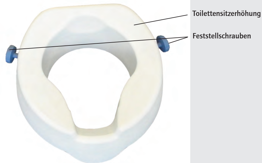
Abb. 1: Toilettensitzerhöhung

Beachten Sie bitte die Textpassagen, die besonders gekennzeichnet sind.